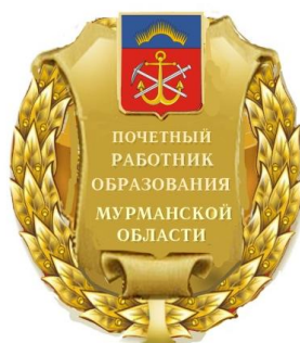
Рисунок нагрудного знака к званию Мурманской области «Почетный работник образования Мурманской области»

На оборотной стороне знака имеется застежка (булавка) для прикрепления его к одежде.